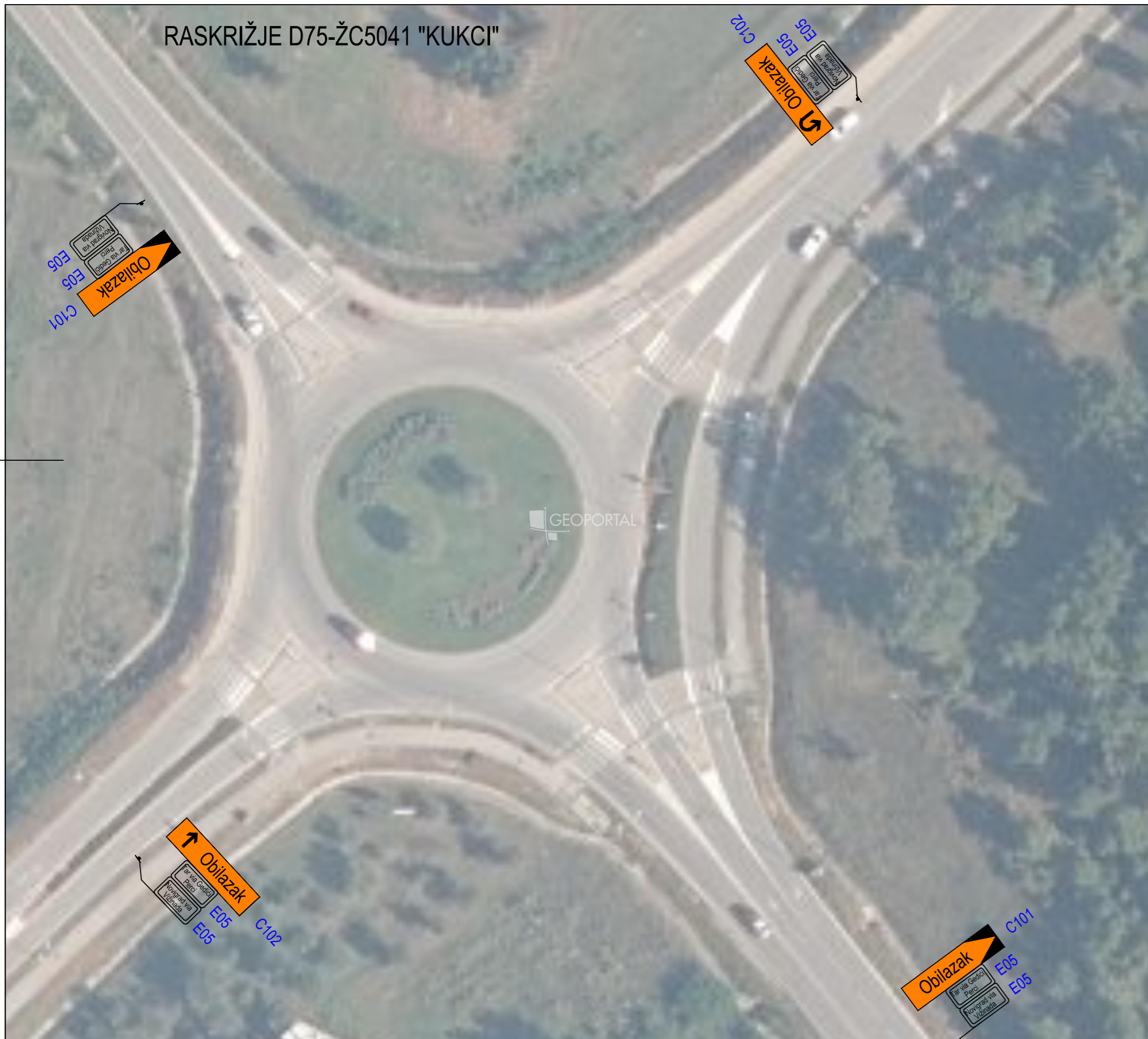
RASKRIŽJE D75-ŽC5041 "KUKCI"